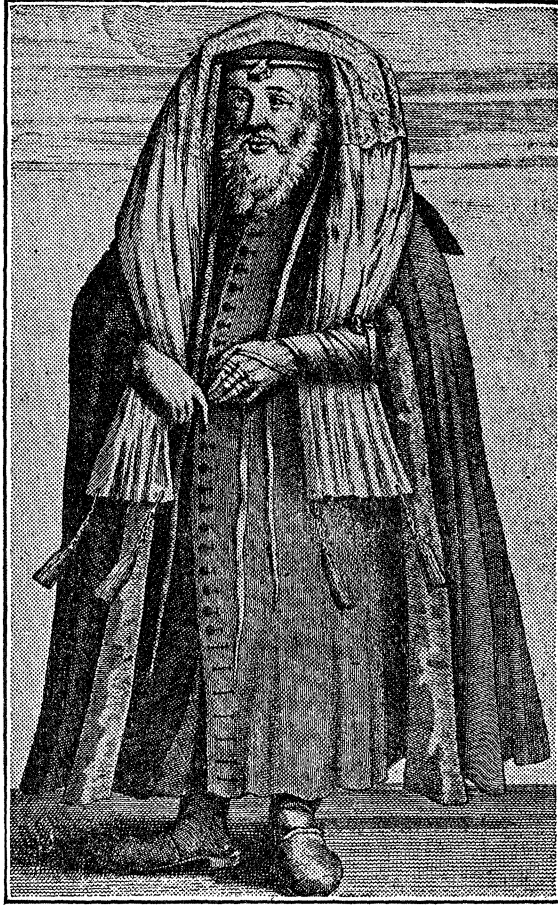
זוי אזוי די "פרושים" פלעגען געהן געקליידעט.